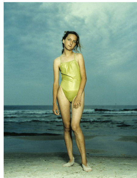
Rineke Dijkstra, 1992.