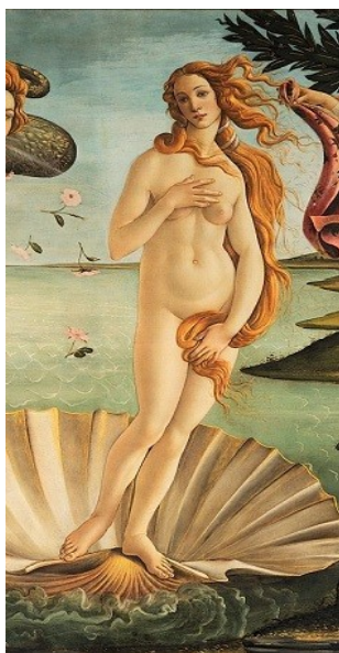
Sandro Botticelli, 1486.

Matériel fourni par l'association : graphite, mie de pain, fusain, pierre noire, sanguine, craie blanche, papier blanc et teinté, aquarelle, encres, gouache, pinceaux, argiles, outils modelage, tournette, tablier. La cuisson des terres n'est pas prise en charge par l'association.